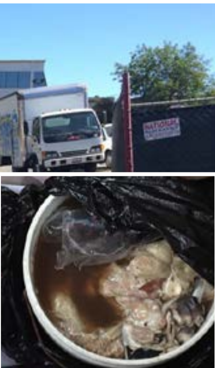
התרנגולות לפני ואחרי